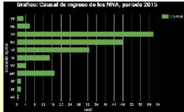
(Grafica de elaboración Propia – Sistematización Proyecto CEDEIJ 2015)

Se debe hacer presente que, las gráficas anteriormente presentadas, se realizaron con muestreo de los casos intervenidos, correspondiente a los 4 primeros meses de intervención de los años que se reportan,